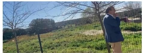
El alcalde delante de la parcela cedida

con necesidades especiales, destinado a toda la comarca, y, a cambio, ¿qué se va a construir para los vecinos? Hay gran necesidad de zonas deportivas, oficina de Correos, espacios para jóvenes, gimnasios, piscina cubierta, centro de cultura, puesto de policía permanente, servicio de microbús, enlaces de transporte con hospitales, etc.